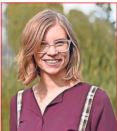
Thema: Zorg

De Leidse stadsfotograaf is dit jaar niet één persoon, maar een groep van zeven jonge antropologen. Ze gaan de Leidse regio door en geven een beeld van het dagelijks leven in de stad en de omgeving. Bij toerbeurt leveren ze een bijdrage aan deze fotoserie en ieder onderzoeken ze een eigen thema in hun fotografie.