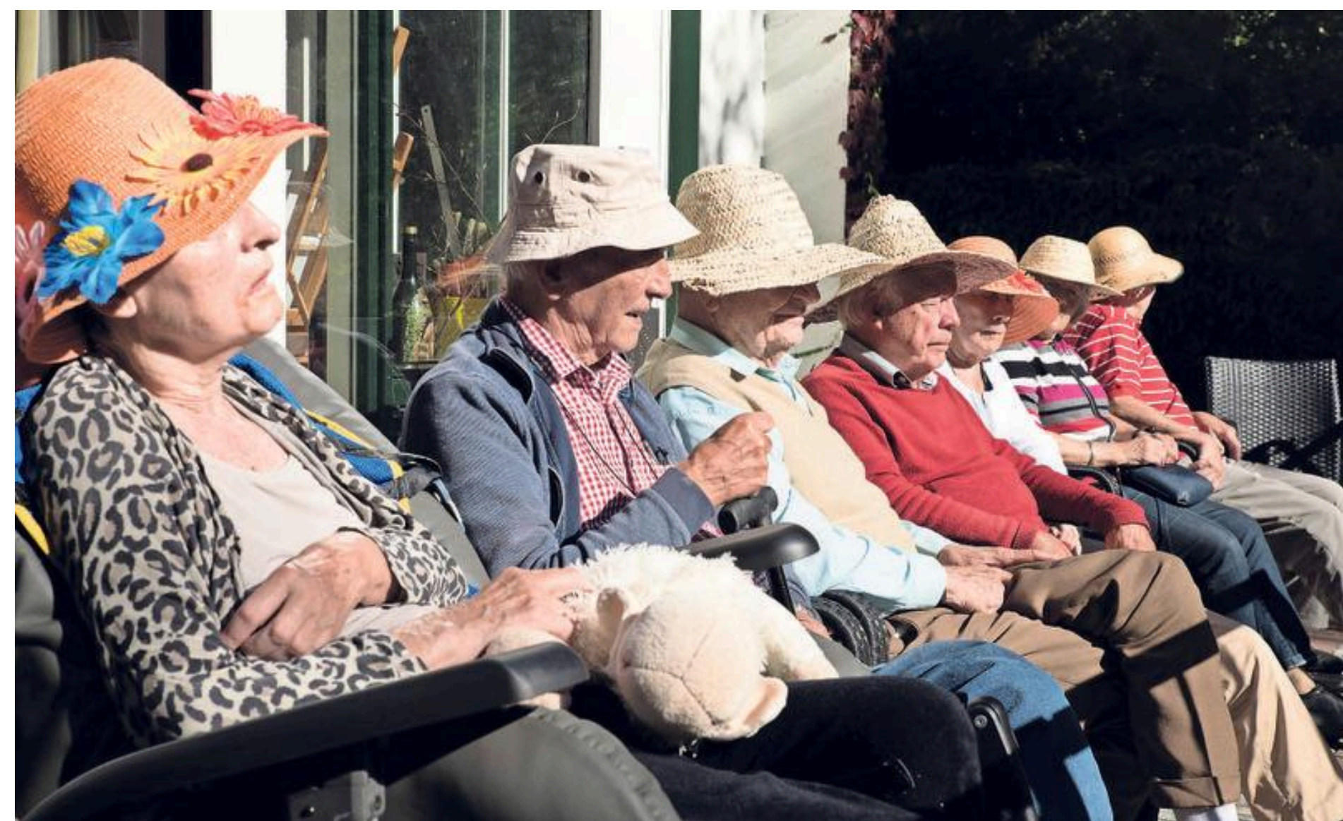
Op het terras van de villa genieten de ouderen van de nazomerzon.

Aan het einde van de dag wordt ik hartelijk uitgenodigd om aan te schuiven op het terras. Het is een mooie nazomerdag, en de zon is zelfs zo sterk dat de zonnehoeden nog een keer uit de kast mogen. Met een wijntje of een glas sap in hun hand zitten de bewoners gezellig op een rij om maximaal van het laatste streepje zon te kunnen genieten. Ze kijken uit op het privébos van de villa. Ik zet ook een oranje zonnehoed op mijn hoofd volg het wijze advies van de man naast me op: „Nu nog even genieten, het is zo weer winter.”