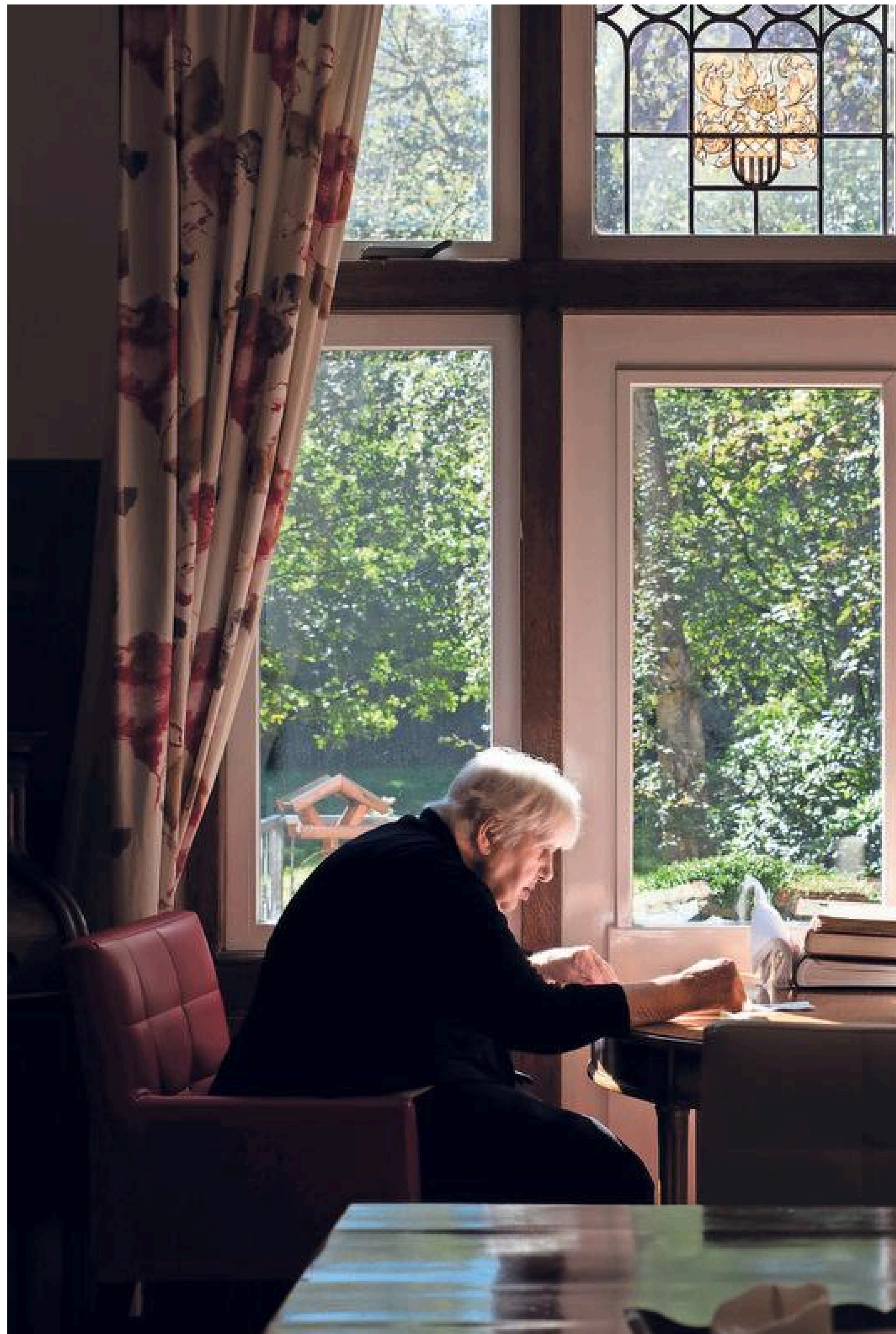
In de woonkamer van de villa leest de mevrouw rustig haar boek.